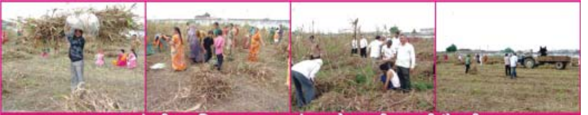
ગઢપુરમાં શ્રી સ્વામિનારાયણ મહામંત્ર મહોત્સવની ચાલતી તેચારી